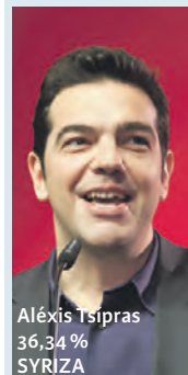
Aléxis Tsípras 36,34 % SYRIZA