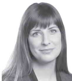
Rebecca Ruiz, conseillère nationale (VD)

Sur le fond, la poursuite des abus dans le domaine des assurances sociales doit évidemment être rendue possible. Elle est même nécessaire pour la crédibilité de l'entier de l'édifice de notre système social. La lutte contre la fraude ne doit toutefois pas être menée à n'importe quel prix! Elle ne justifie pas que l'on sacrifie le principe de la proportionnalité et les fondements de l'État de droit. Et la poursuite de tels délits doit être menée par du personnel assermenté ou par la police, à l'instar de ce qui se pratique de manière totalement satisfaisante dans de nombreuses villes et dans certains cantons de Suisse.