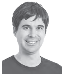
Samuel Bendahan, conseiller national (VD)

L'INITIATIVE MONNAIE PLEINE RESSEMBLE À UN BON VIEUX PIÈGE À SOURIS : UN APPÂT ALLÉCHANT ET UN DÉSASTRE SI L'ON CÈDE À LA TENTATION. CETTE INITIATIVE ATTIRE NATURELLEMENT UNE CERTAINE SYMPATHIE À GAUCHE, CAR ELLE CRITIQUE NOTRE SYSTÈME FINANCIER. OR, NOUS SOCIALISTES CONSIDÉRONS QUE CE SYSTÈME EST INJUSTE ET SOMMES TOUJOURS TENTÉS PAR LES PROPOSITIONS DE LE RÉFORMER, PARFOIS DRASTIQUEMENT. LA QUESTION FONDAMENTALE EST LA SUIVANTE : EST-CE QUE LE CHANGEMENT PROPOSÉ VA DANS NOTRE SENS OU NON ?