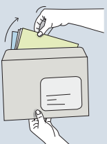
እቲ ዝቐርብ ፖስታ ይኸፈት

ኣዝዩ ዝተመሓየሽ ንዑቅብኛታት ስለዚ መስርሕ ምትዕጻጽፍ ሕጋውነት ሃገር ብዘይ ገለ ጸገም ይሰልጥ ፡ ንሙኻኺ ንነዊሕ ግዜ ዝነበረ ናይ ይግባይ ገደብ ብናትና ርድኢት ዝበለጸ ነይሩ ። ነዚ ግን ዝቐይር ነገር የለን ፡ እዚ ሕጂ ዝቐርብ ዘሎ ንናይ ዑቅባ ሓተትቲ ይሓይሽ ።