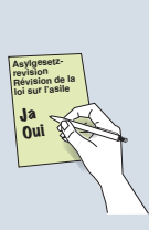
ናይ ወረቐት ምርጫ ይምላእ