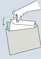
ናይ ፖስታ መምረጽን ሕጋዊ መንነትን ኣብቲ ዝቐርብ ፖስታ ይቐመጥ፡