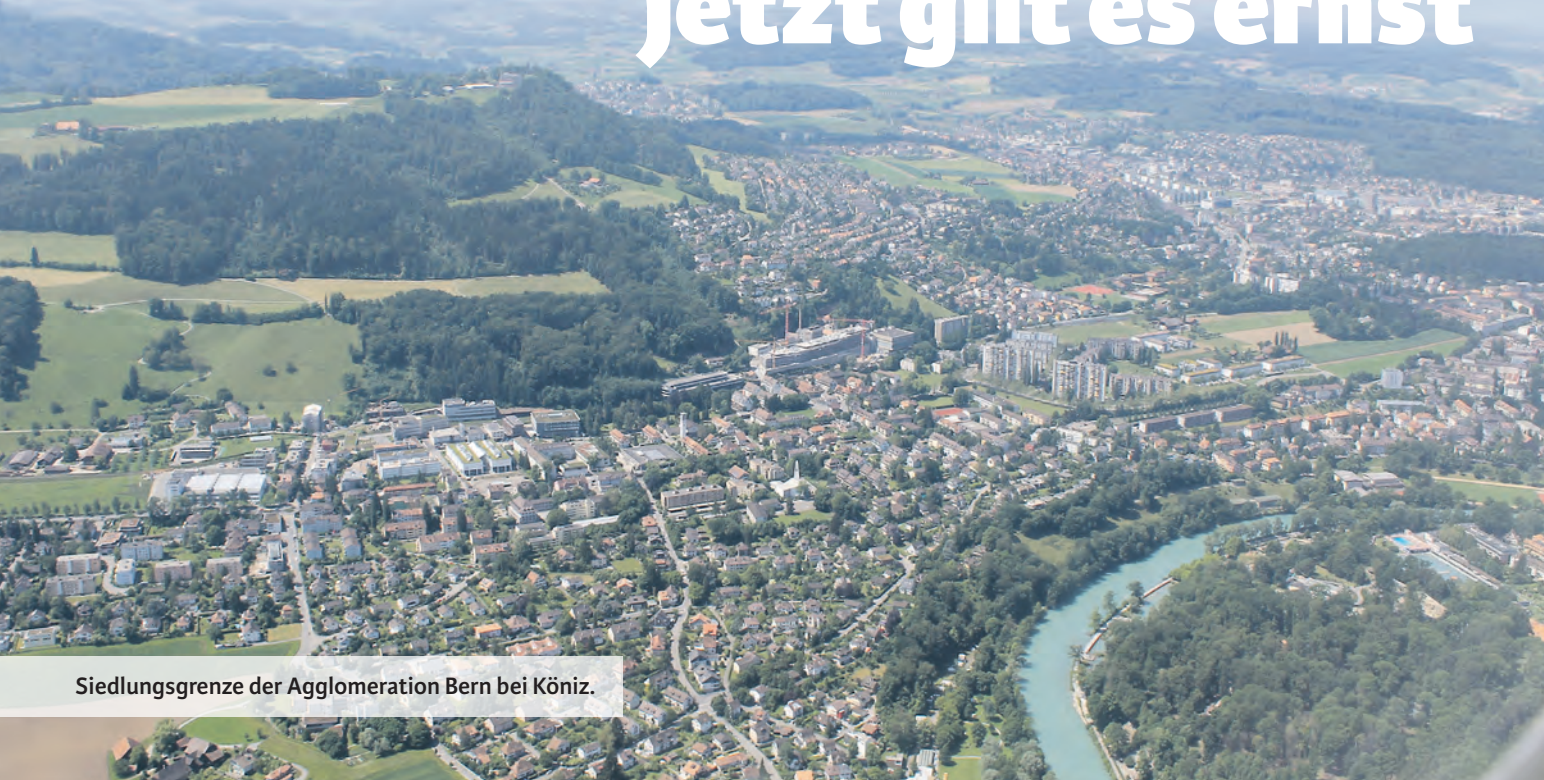
Siedlungsgrenze der Agglomeration Bern bei Köniz.

BEI DER GEGENWÄRTIG IM GROSSEN RAT ZUR DEBATTE STEHENDEN REVISION DES BAUGESETZES GEHT ES UM EIN WICHTIGES ZIEL AUS DER WAHLPLATTFORM 2014 DER SP. DIE STOSSRICHTUNG, WIE SIE VOM NATIONALEN SOUVÄRÄN IM MÄRZ 2013 MIT EINEM KLAREN JA ZUM REVIDIERTEN RAUMPLANUNGSGESETZ VORGEZEIGT WURDE, IST AUF KANTONS GEBIET WEITERZUFOLGEN. STATT UNVERSEHRTE LANDSCHAFTEN ZU ÜBERBAUEN, SOLLEN SIEDLUNGEN INNERHALB DER BESTEHENDEN BAUZONEN WEITERENTWICKELT WERDEN.