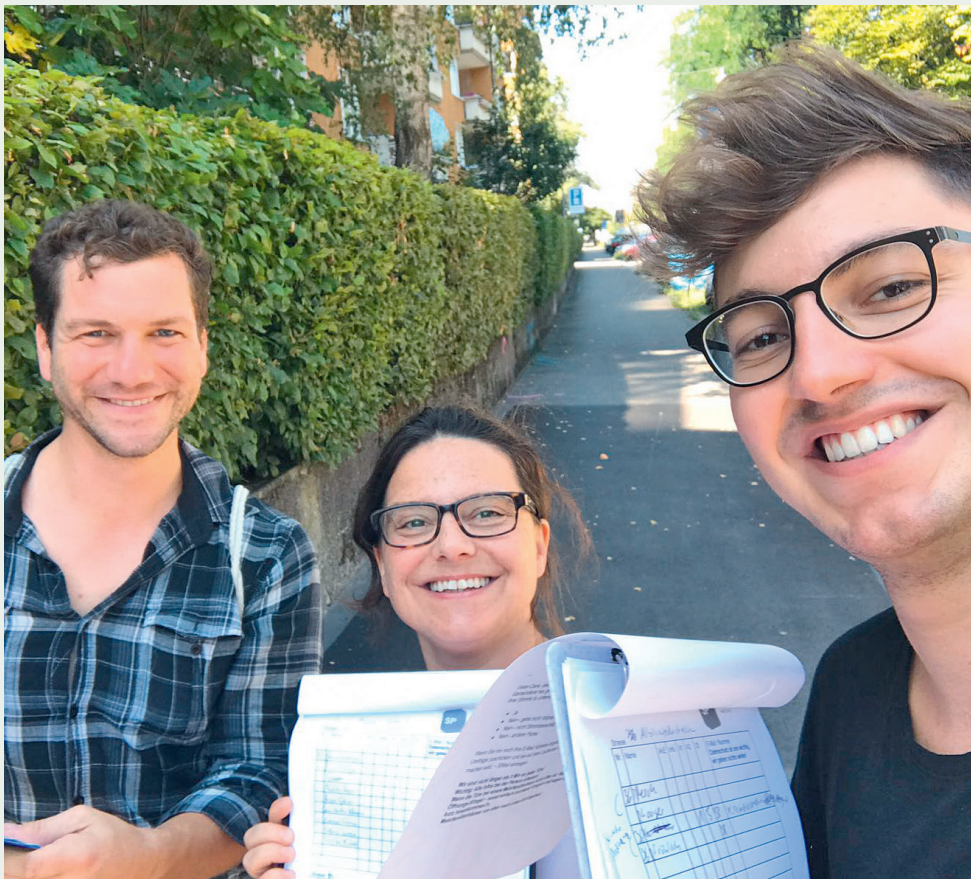
Mitglieder der SP Zürich bei der Quartierumfrage