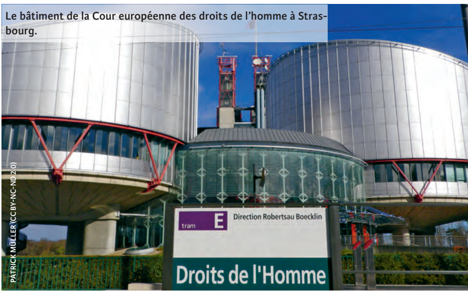
Le bâtiment de la Cour européenne des droits de l'homme à Strasbourg.