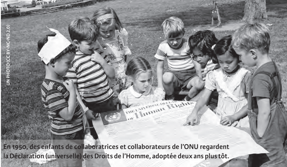
En 1950, des enfants de collaboratrices et collaborateurs de l'ONU regardent la Déclaration (universelle) des Droits de l'Homme, adoptée deux ans plus tôt.