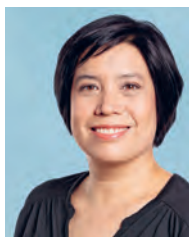
Min Li Marti, Nationalrätin ZH

Ob Wunsch oder Notwendigkeit: Für viele Eltern ist es wichtig, Familie und Beruf unter einen Hut zu bringen. Diese Vereinbarkeit ist auch ein entscheidender Faktor für mehr Gleichstellung. Denn noch immer stecken Frauen zugunsten von Kindern und Familie beruflich zurück und arbeiten häufig Teilzeit. Das schlägt sich im Portemonnaie nieder: Mütter leisten viel und verdienen wenig. Bezahlbare Betreuungsangebote für Kinder leisten darum einen wichtigen Beitrag zu mehr Gleichstellung.